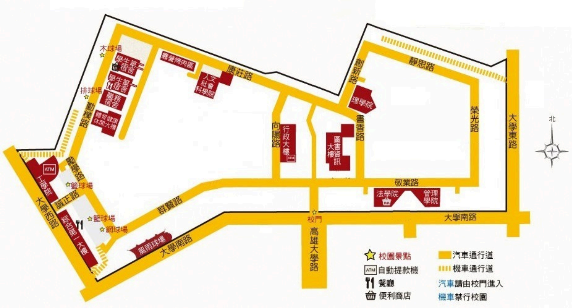
國立高雄大學校內大樓位置圖