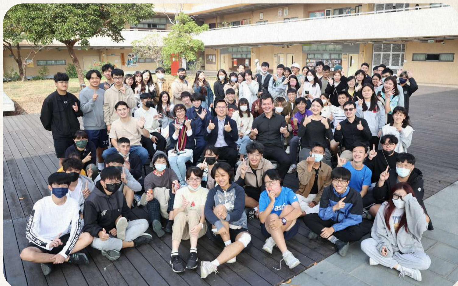
本系師生建築設計「跨·度Between the Scales」及素描「安居左營」聯合成果展覽開幕