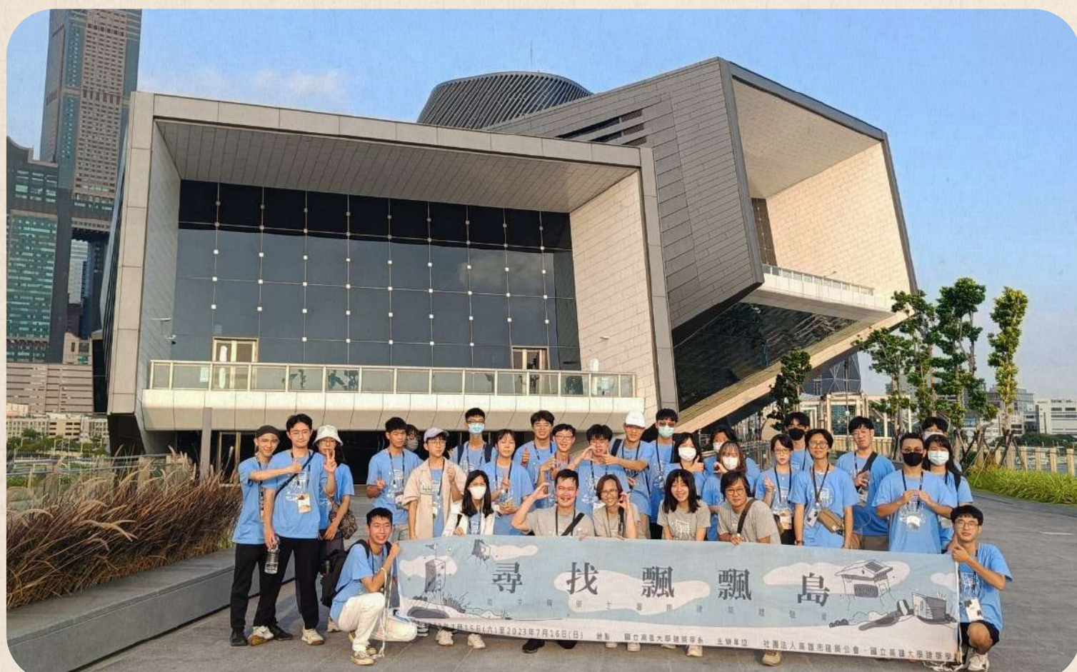
本系主辦暑期建築營「尋找飄飄島」參訪高雄港埠旅運中心

高雄大學建築系畢業後，您將擁有建築設計與規劃相關的專業知識和技能，為您提供多元的職業出路和發展機會，職業包含建築設計師、室內設計師、施工管理師、建築技術專家(例如建築技術顧問、節能或綠建築專家)、研究和教育學者、自行開業、空間藝術家。