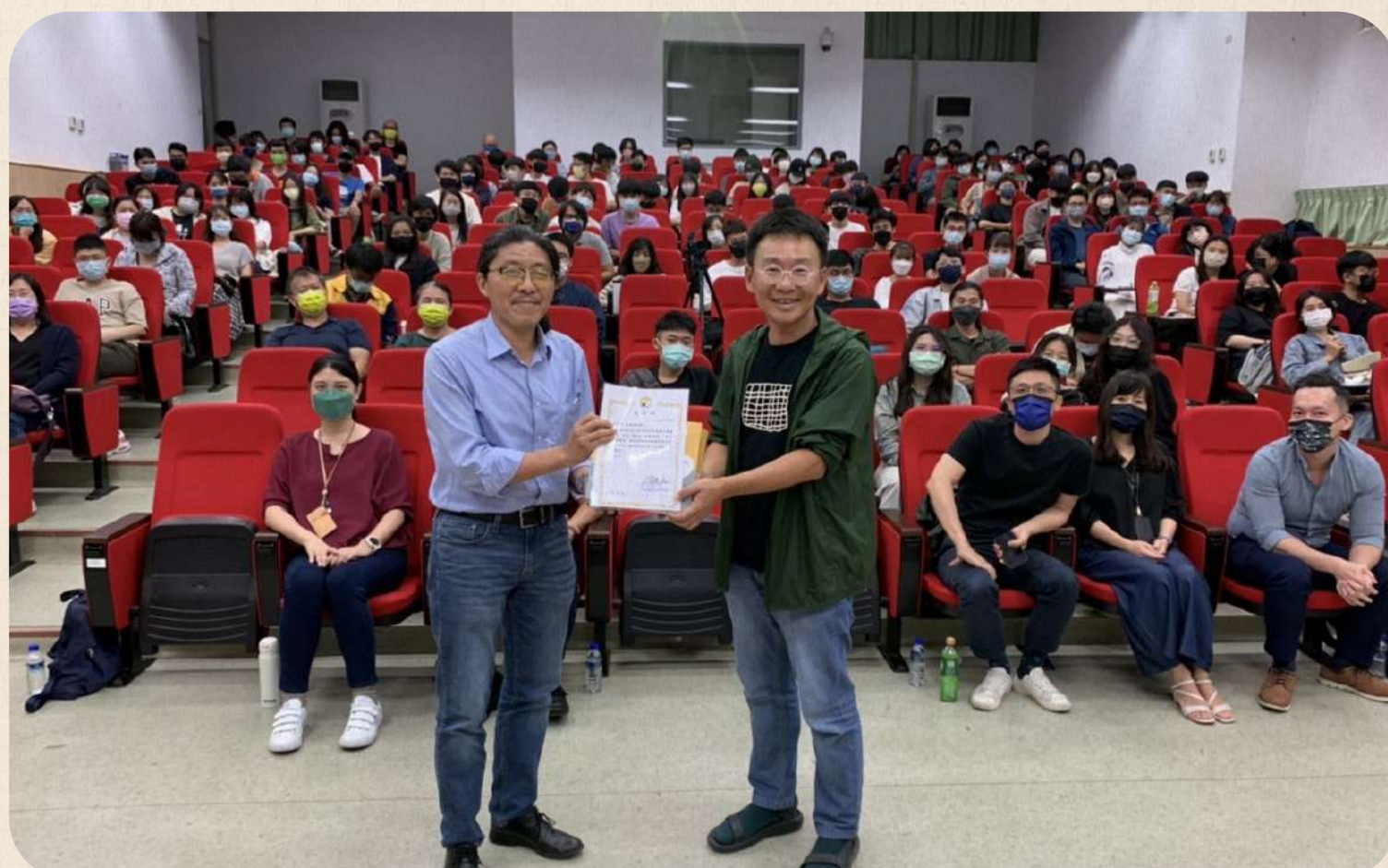
本系週三講座黃聲遠建築師演講主講「和風一樣自由宜蘭.新竹」