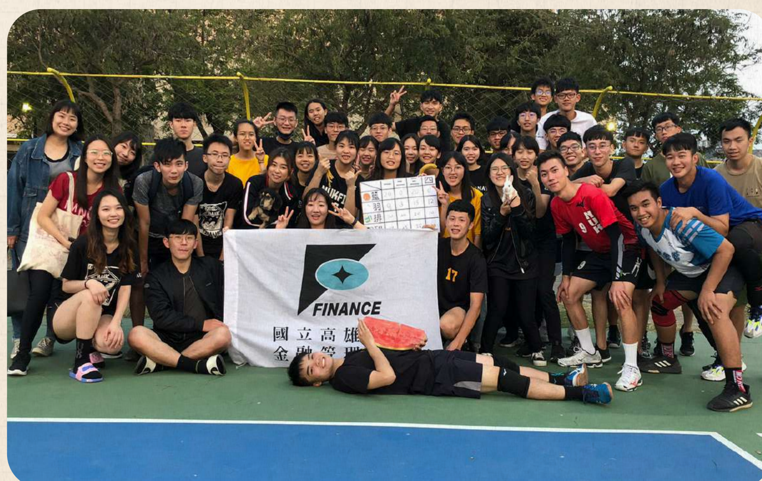
系上學生活動照片-系抗

若您有創新創業的夢想，或是想要擁有專業的融資和投資背景，或者成為專業的財金專業經理人，加入高大財金系，助您實現未來的事業藍圖。