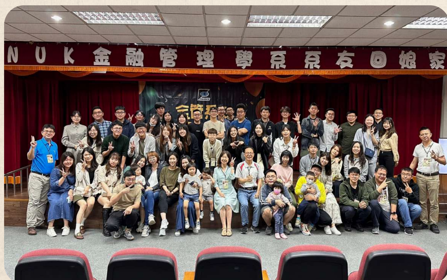
系友聯繫-112年系友回娘家

各金融機構、上市櫃公司、中小企業、政府機關、會計師事務所、與顧問公司等機構擔任專業經理人、理財顧問、基金經理人、財務分析人員等金融服務相關職缺。