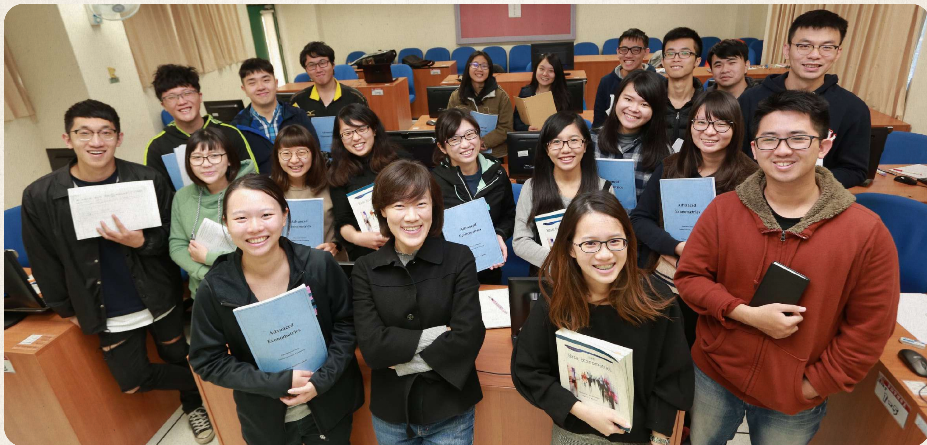
專業養成-投資系統開發